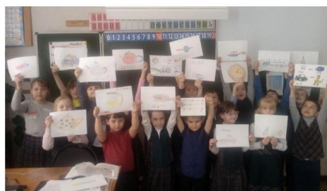
Мирина Л.П., учитель начальных классов

В рамках недели ученики 4 класса провели акцию «Дети против жестокости и насилия». Обучающиеся 1-3 классов их поддержали и сделали поделки для выставки «Ремень не для порки».