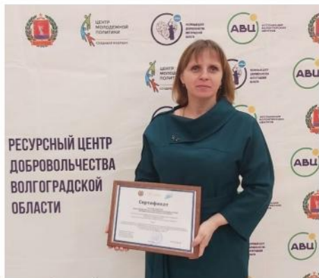
РЕСУРСНЫЙ ЦЕНТР ДОБРОВОЛЬЧЕСТВА ВОЛГОГРАДСКОЙ ОБЛАСТИ

18 центров школьного добровольчества откроют в Волгоградской области в 2021 году. Они будут размещены в школах Киквидзенского, Алексеевского, Городищенского, Среднеахтубинского, Иловлинского, Николаевского, Светлоярского, Еланского, Михайловке, Волжском, а также в восьми общеобразовательных организациях Волгограда.