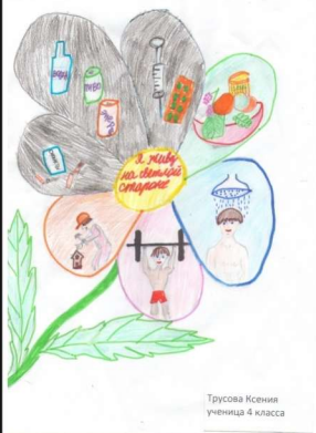
Трусова Ксения ученица 4 класса

«Я, ты, он, она – мы здоровая страна!» Это не просто слова, учащиеся начальных классов знают, что здоровье – это бесценный дар, который преподносит человеку природа, и его надо беречь. Нам не нужно забывать, что потерять здоровье легко, а вот вернуть его очень трудно.