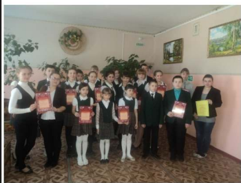
Победители и призёры конкурса

Так следуйте, дорогие наши читатели, словам великого поэта!