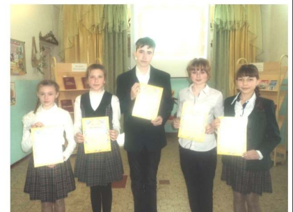
Победители конкурса чтецов среди 5-6-х классов