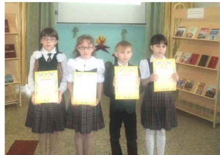
Победители конкурса чтецов среди учеников 1-4-х классов

Победители конкурса были награждены Почётными грамотами. Участие школьников в конкурсе в очередной раз доказало, что они помнят и чтят своих прадедов, о которых знают только по фотографиям и рассказам родных, что интерес ребят к историческому прошлому своего народа не угасает.