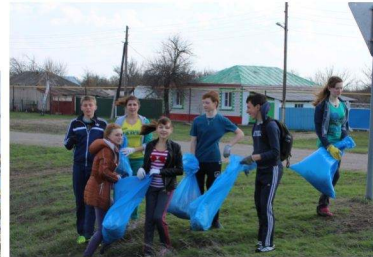
Убираем мусор на улицах села