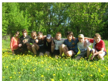
Солнце, воздух, позитив!