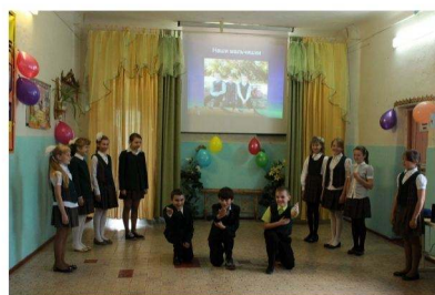
команда 5а класса "Алые паруса"