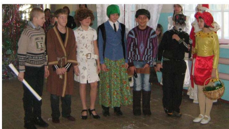
Угадайте, кто есть кто?