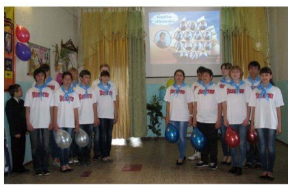
команда 8а класса "Позитив"