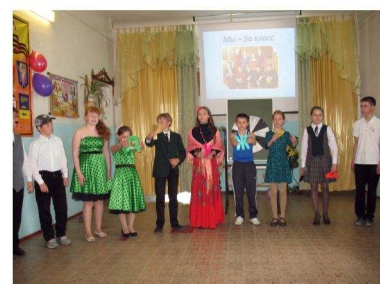
команда 6а класса "РИТМ"