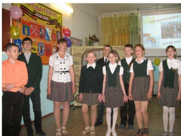
команда 6б, 10 классов "Легендарная радуга"