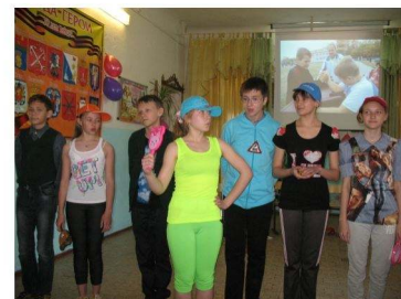
команда 7-го класса "Новая волна"