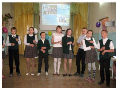
команда 5б класса "НЛЮ"