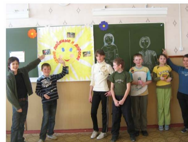
Посвящается самым любимым и дорогим -мамам!